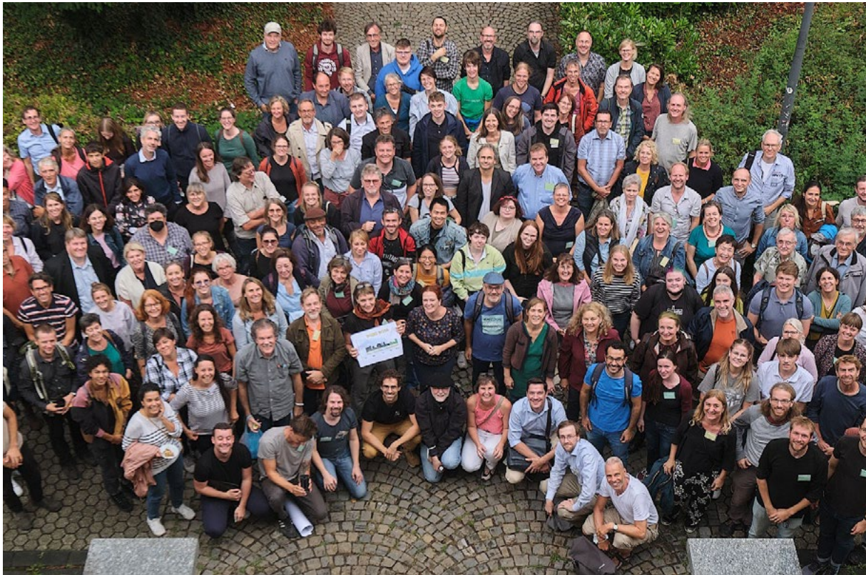
Die mehr als 100 Teilnehmenden des 4. Bonn4Future-Klimaforums.