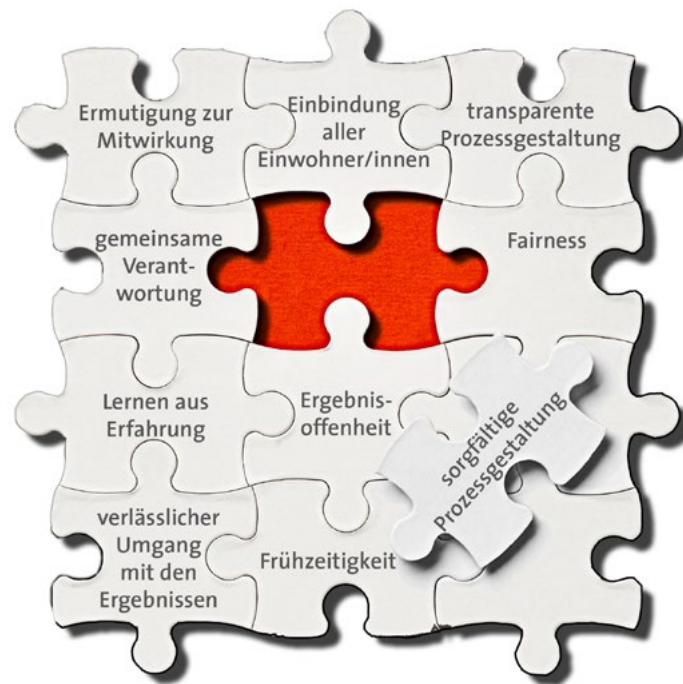
Abbildung 2: Cover Leitlinien Bürgerbeteiligung Bonn.